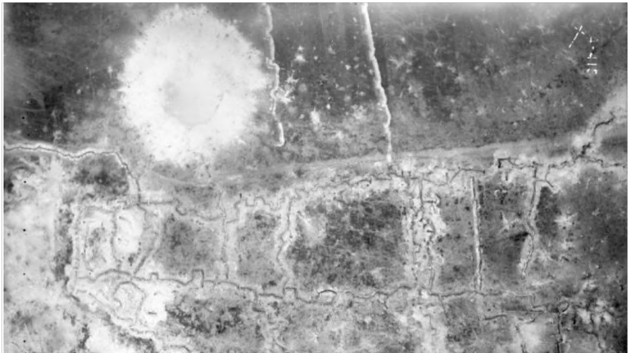
Кратер от взрыва в 2017 году (100 лет спустя):